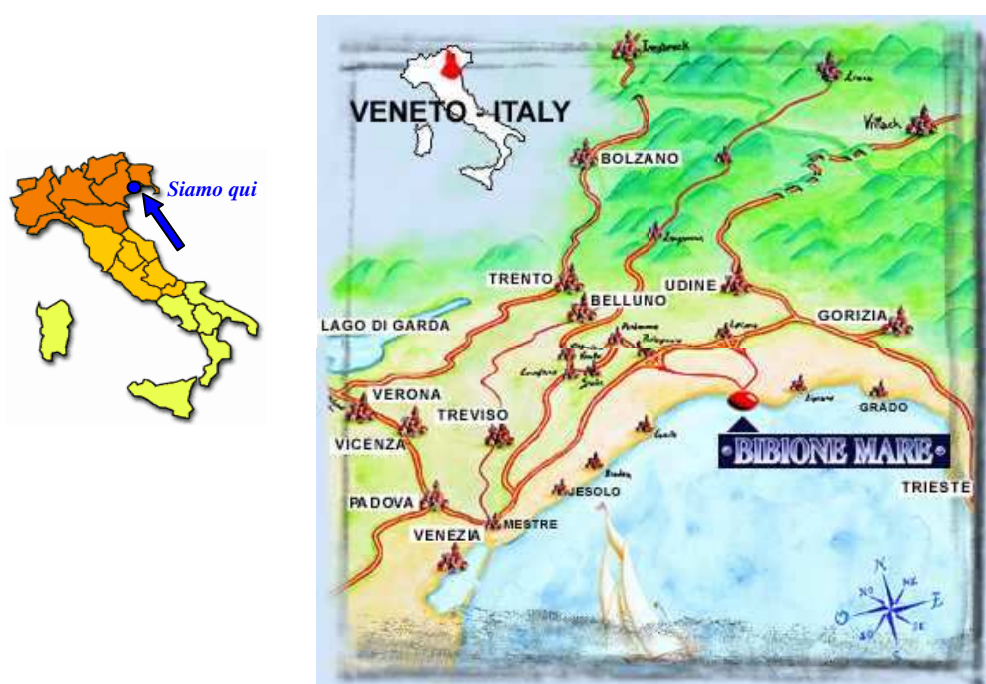
Figura 2.1: Inquadramento geografico del sito di Bibione

Sita nel Comune di S. Michele al Tagliamento, all'estremo nord della provincia di Venezia (vedi figura 2.1), la località di Bibione si presenta come una penisola confinante ad est con la foce del fiume Tagliamento, a sud con il mare Adriatico, ad ovest con la bocca di comunicazione del sistema vallivo interno, denominato porto Baseleghe, a nord-ovest con il canale denominato Litoranea Veneta e, infine, collegata all'entroterra dall'argine del fiume Tagliamento.