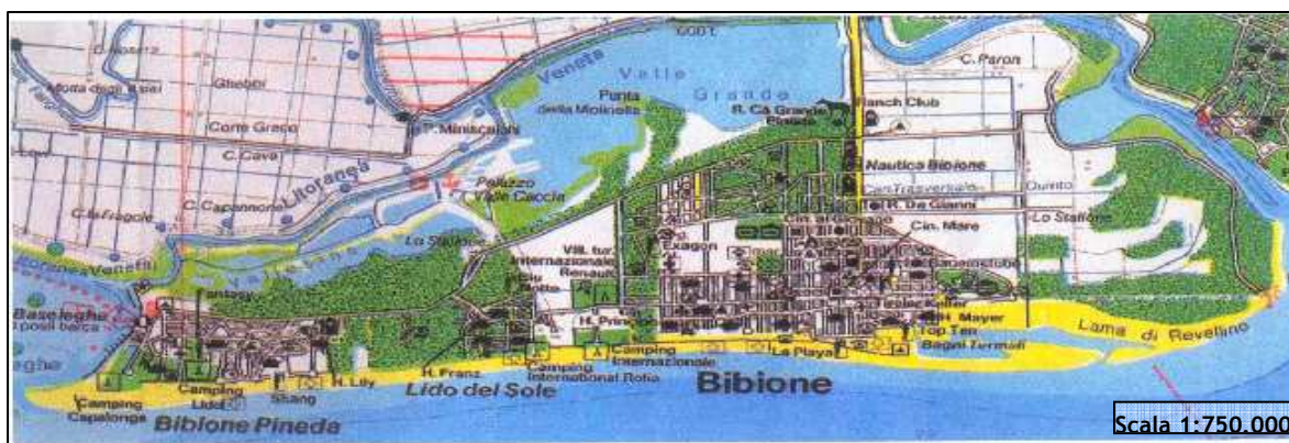
Figura 2.3: Planimetria territoriale di Bibione

Bibione, data la conformazione del suo territorio riportata in figura 2.3, è unito all'entroterra da un unico ponte. Le strade principali, che collegano i tre poli abitativi, sono parallele al litorale e intersecano le secondarie che consentono l'accesso al mare.