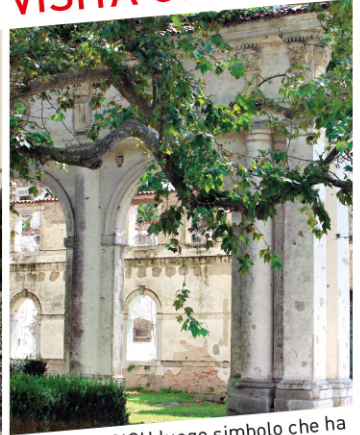
VILLA IVANCICH luogo simbolo che ha ospitato lo scrittore e Premio Nobel Ernest Hemingway