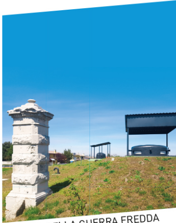
BUNKER DELLA GUERRA FREDDA segno della contrapposizione politica, ideologica e militare