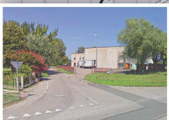
Quadrante del Commercio e della Logistica Formazione di una polarità nel quadrante del commercio e della logistica.