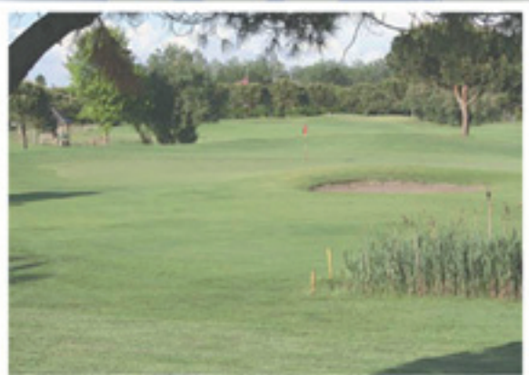
Golf Localizzazione di un campo da golf nella Terra di Mezzo.