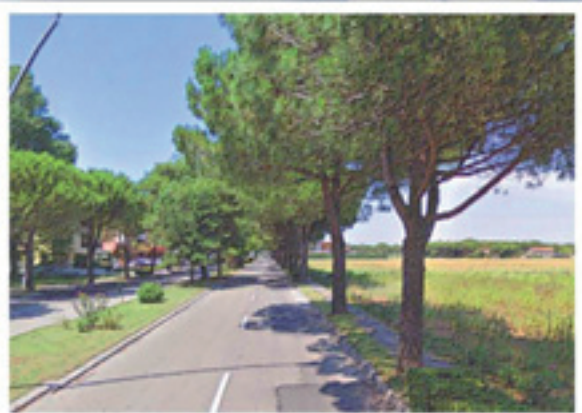
Quadrante Residenti Rafforzamento della residenza stabile nel quadrante dei residenti.