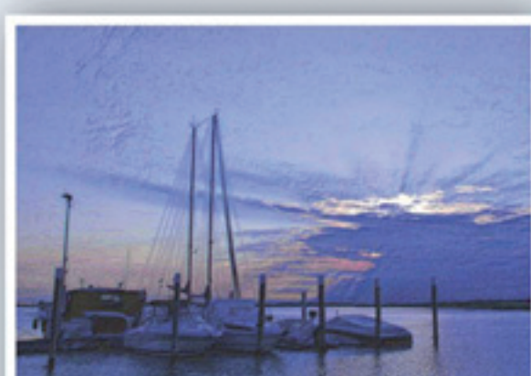
Porto Turistico Completamento del sistema della portualità turistica.