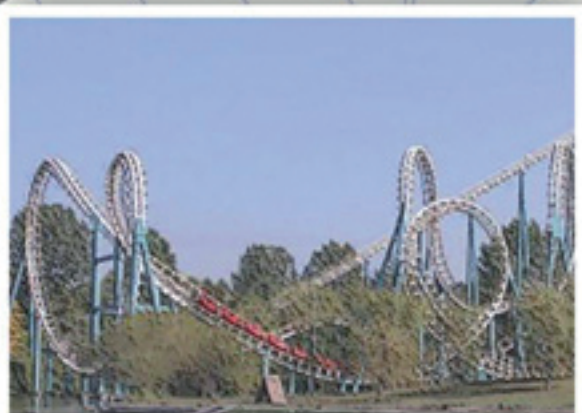
Parco Tematico Localizzazione di un Parco Tematico nella Terra di Mezzo.