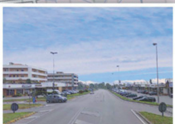
Strada Mercato Riqualificazione della SS 14 come Strada Mercato.