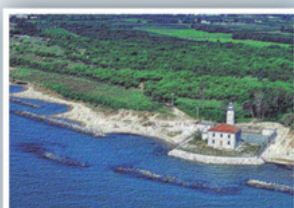
Parco della foce del Tagliamento Tutela e valorizzazione dell'area nucleo alla foce del Tagliamento.