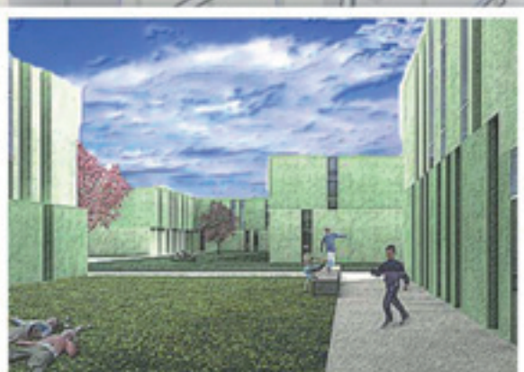
Campus Scolastico Formazione di un nuovo Campus scolastico in posizione centrale rispetto al sistema insediativo.