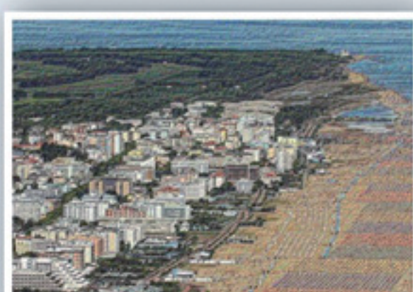
Quadrante degli Alberghi Riqualificazione e potenziamento delle strutture ricettive nel quadrante degli alberghi.