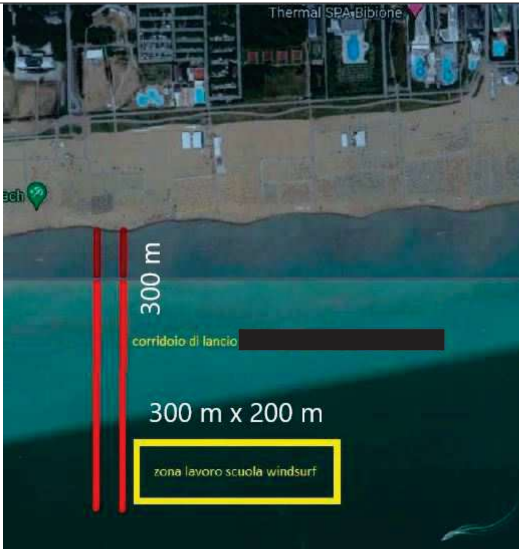
Spazio acqueo pubblico per tavole e windsurf (fronte piazzola n. 10)