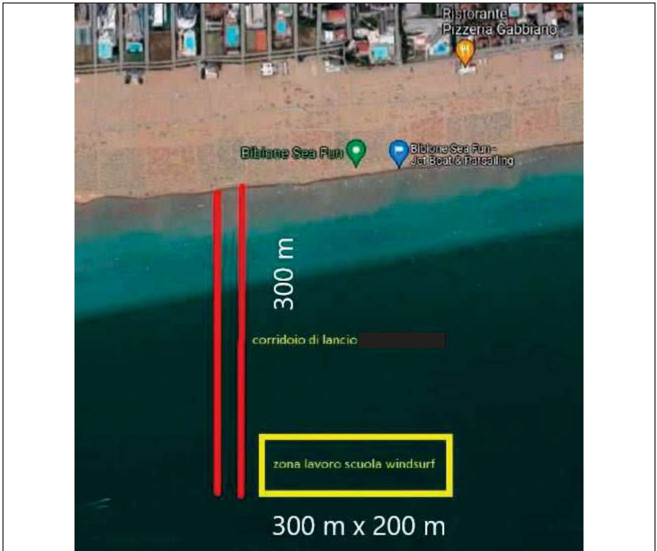
Spazio acqueo pubblico per tavole e windsurf (fronte piazzola n. 18)