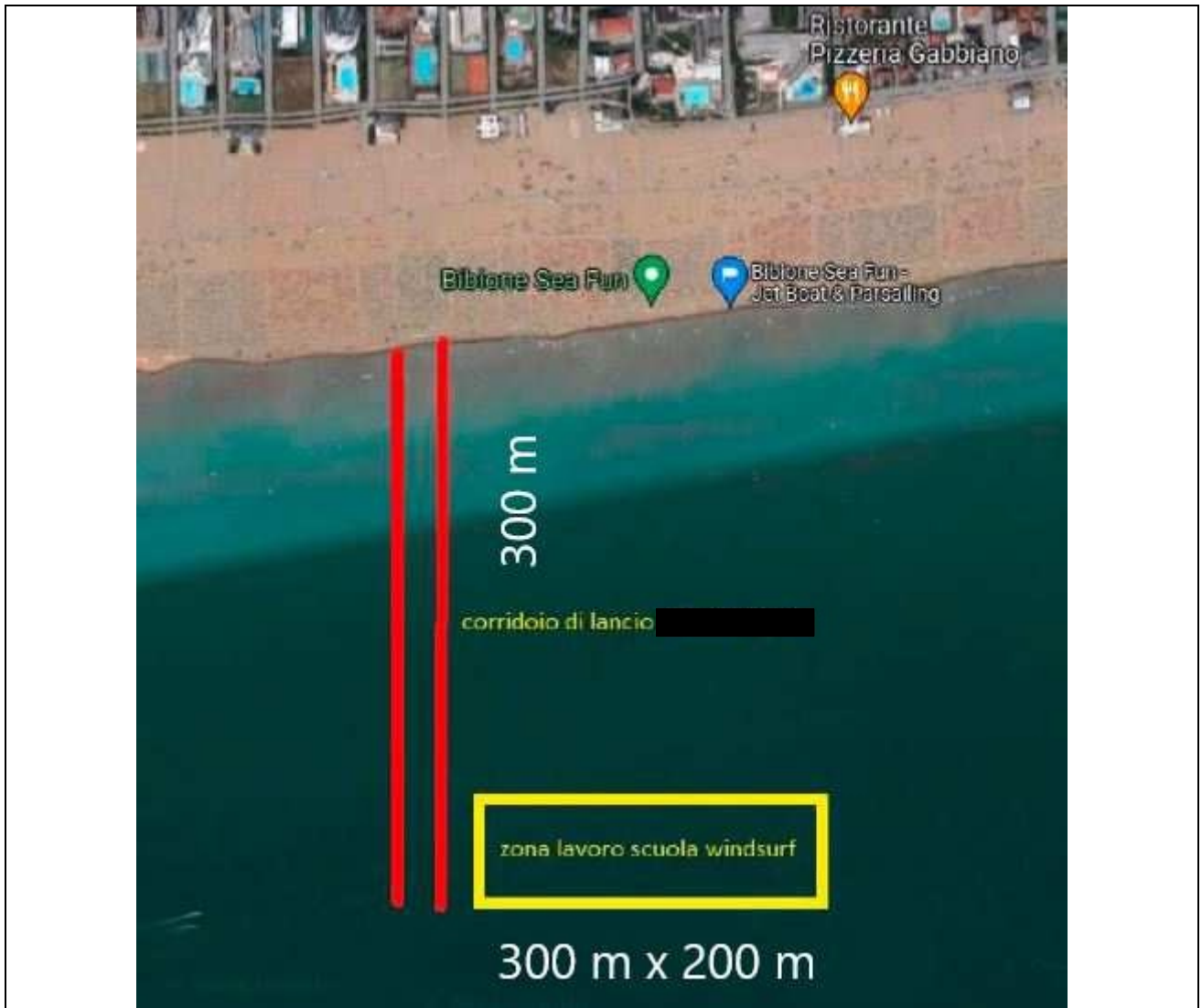
Spazio acqueo pubblico per tavole e windsurf (fronte piazzola n. 18)