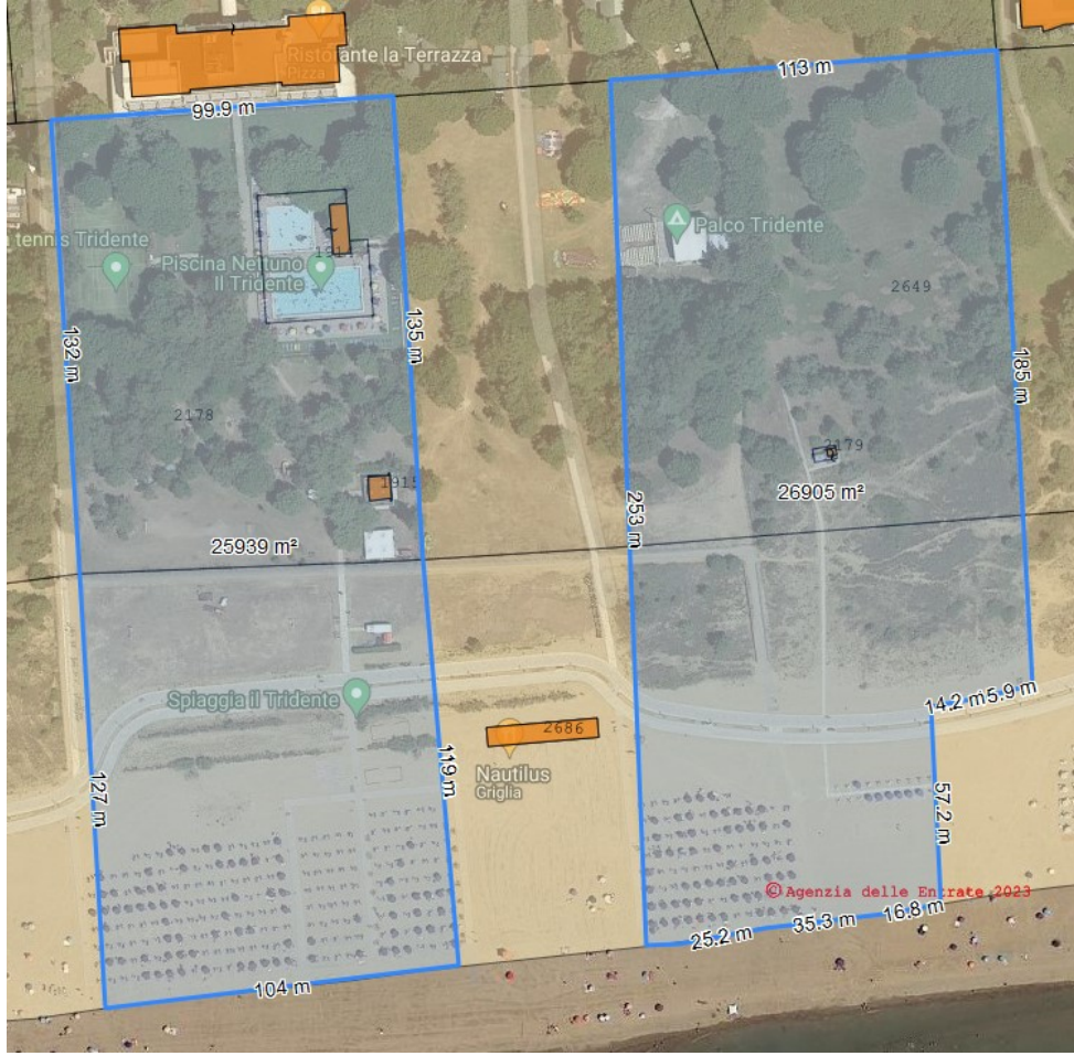
PPA tav. 8B estratto - non in scala

Istanza prot.n. 17136/30.06.2023 su https://www.formaps.it/ - estratto non in scala