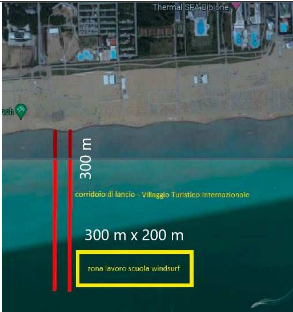
Spazio acqueo pubblico per tavole e windsurf (fronte concessione demaniale COBB piazzola n. 10 Villaggio Turistico Internazionale)