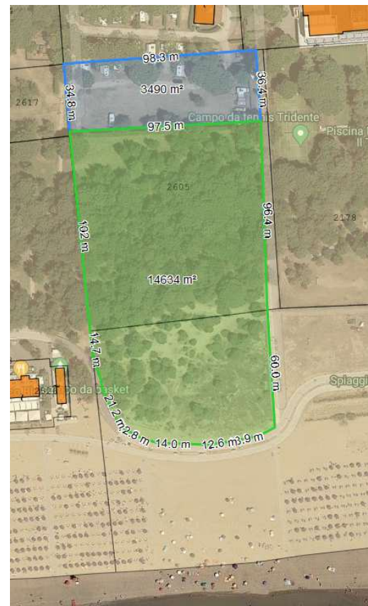
https://www.formaps.it/ - estratto non in scala