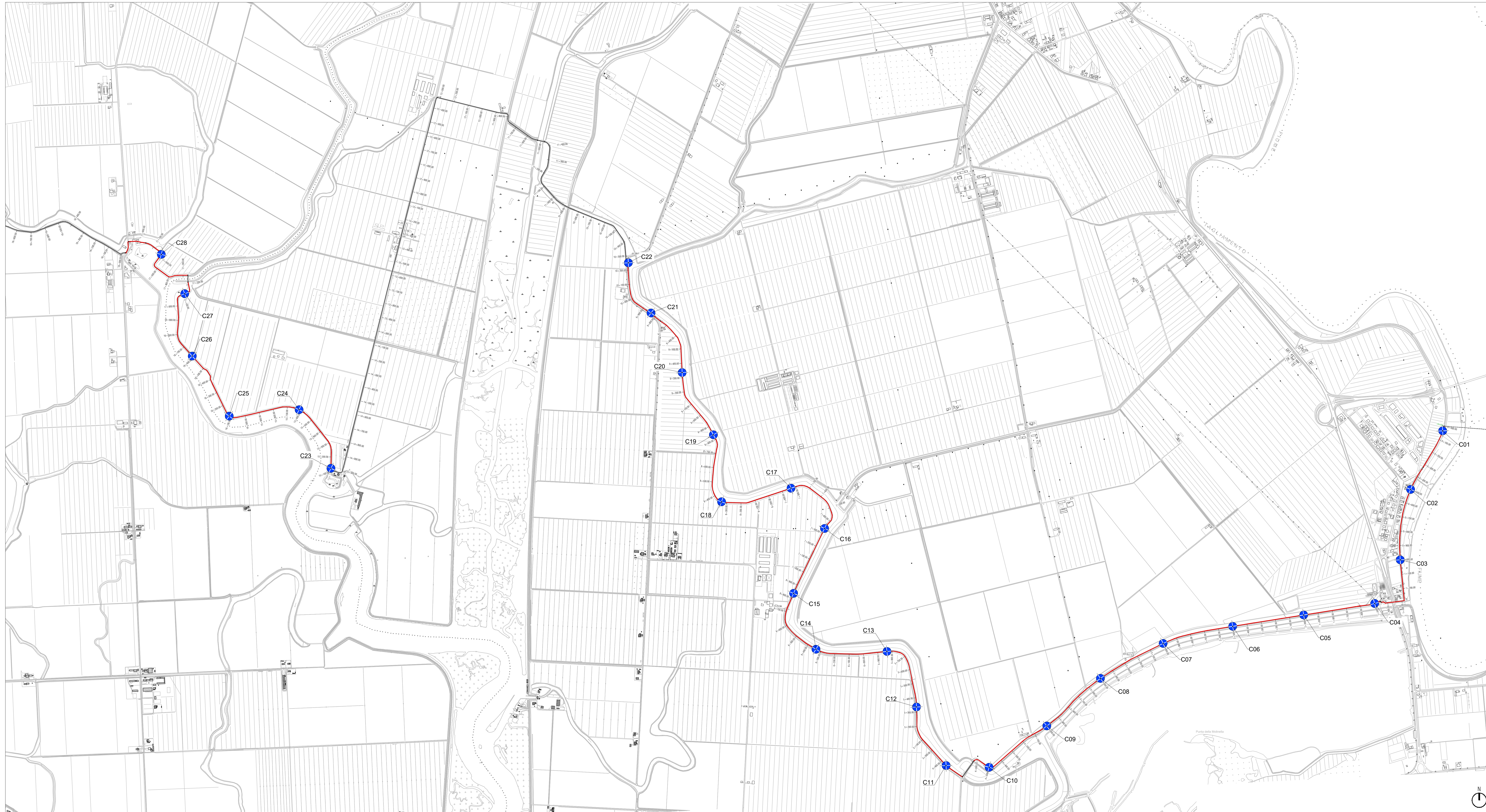
INDIVIDUAZIONE INDAGINI COMUNE DI SAN MICHELE AL TAGLIAMENTO | Scala 1:10.000