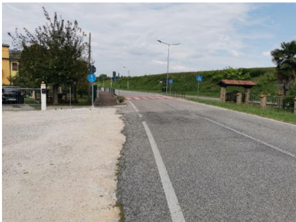
FOTO 1: Punto di collegamento con il tratto di pista ciclabile esistente – Intersezione con via San Filippo e vista corpo arginale