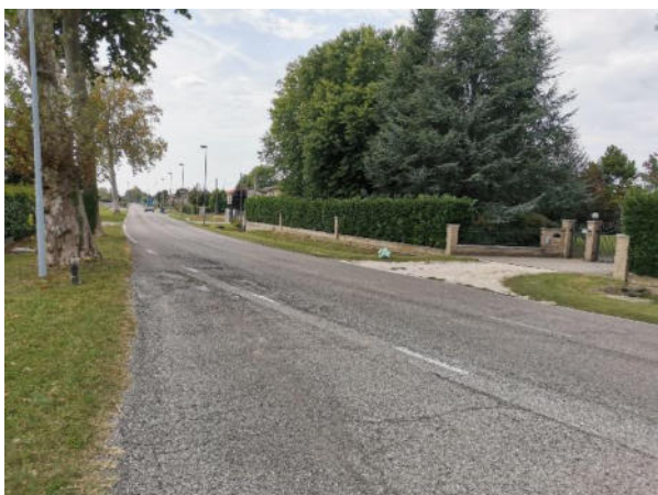
FOTO 3: Intersezione con via R. Morandi e vista sul tratto rettilineo