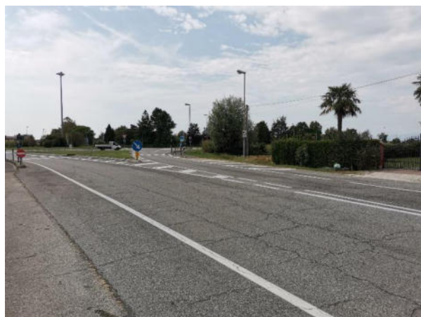
FOTO 4: Punto terminale di collegamento con la rotatoria (intersezione Strada Regionale n.74)