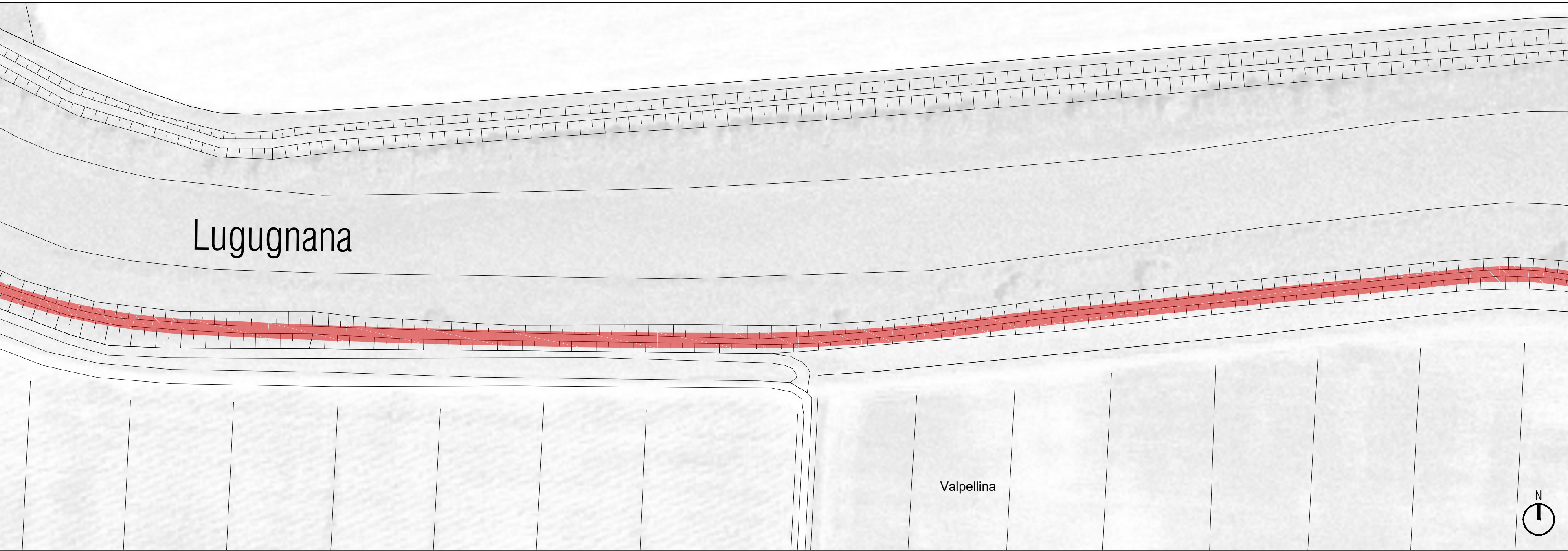
PLANIMETRIA DSOTTOSERVIZI - QUADRO 11 | Scala 1:1000