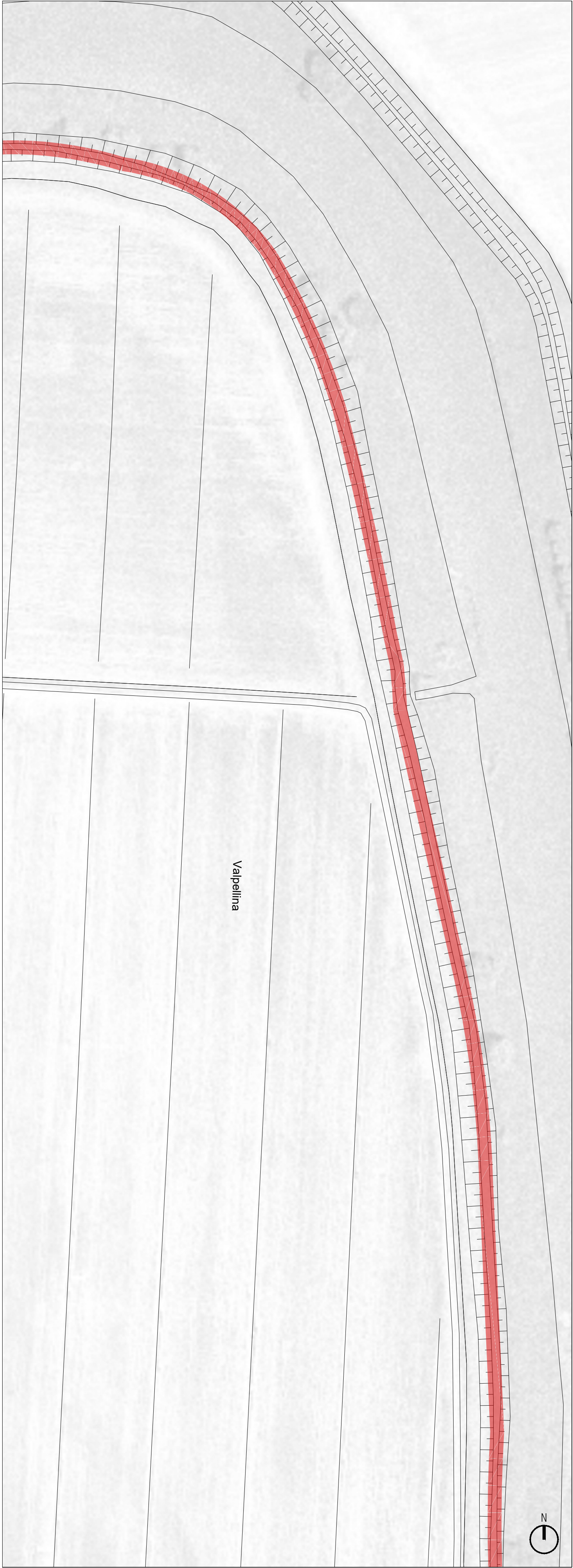
PLANIMETRIA SOTTOSERVIZI - QUADRO 10 | Scala 1:1000